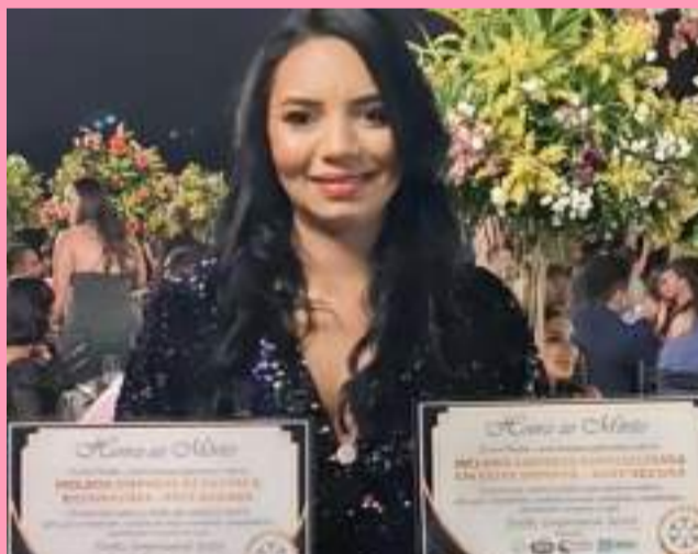
Naty está sempre trazendo novidades para seus clientes e esse ano de 2024 promete, não é mesmo?