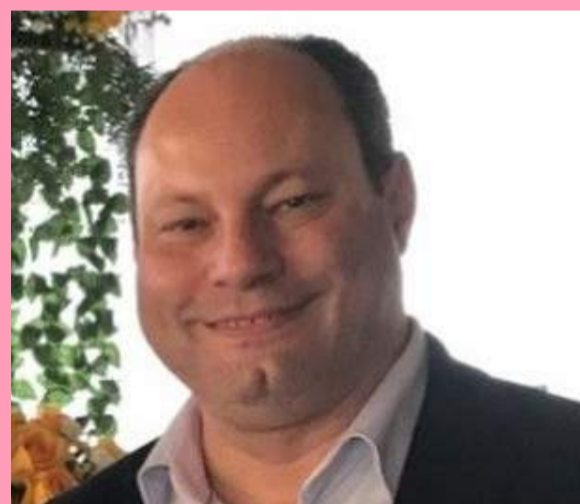
Zezé já iniciou o ano completando mais uma primavera! Desejamos felicidades e um ano incrível!