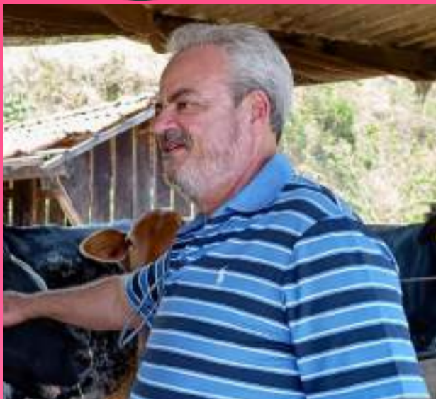
Dia 10 foi aniversário do nosso atual Prefeito Celso Cota! Desejamos muita paz, saúde e sucesso!

Endereço: Rua Bom Jesus - 123 - Barro Preto WhatsApp: 31 9 8223-9194