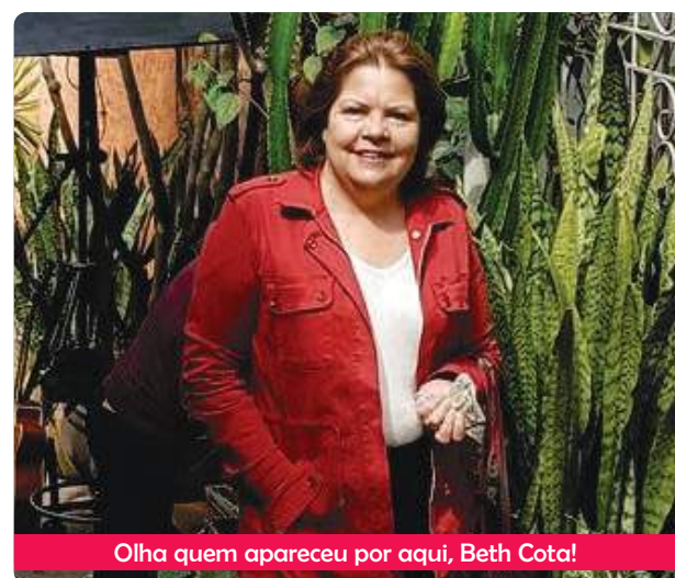
Olha quem apareceu por aqui, Beth Cota!