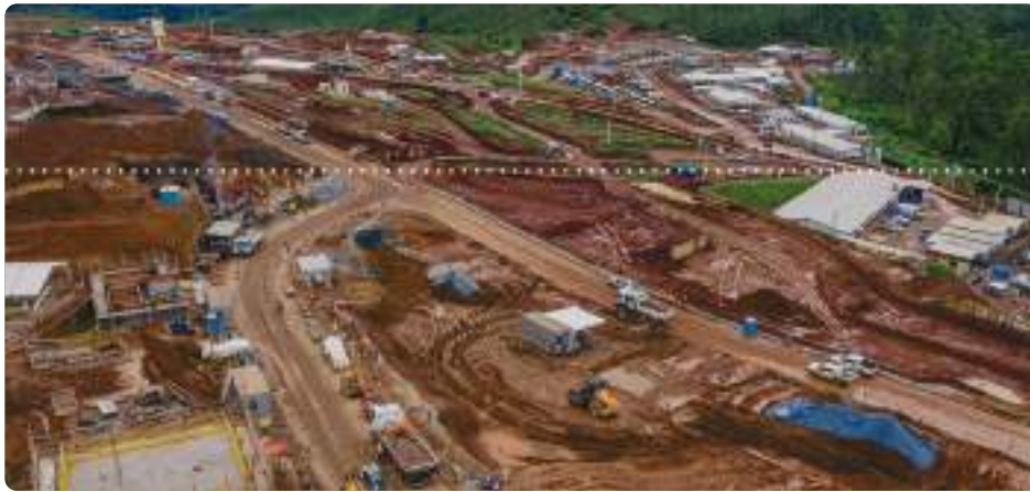
Regional de Governador Valadares (MG).

Entre os investimentos previstos estão a criação do Distrito Industrial de Rio Doce (MG) e a reestruturação de 153 km de estradas e de até 900 escolas, além da conclusão das obras do Hospital