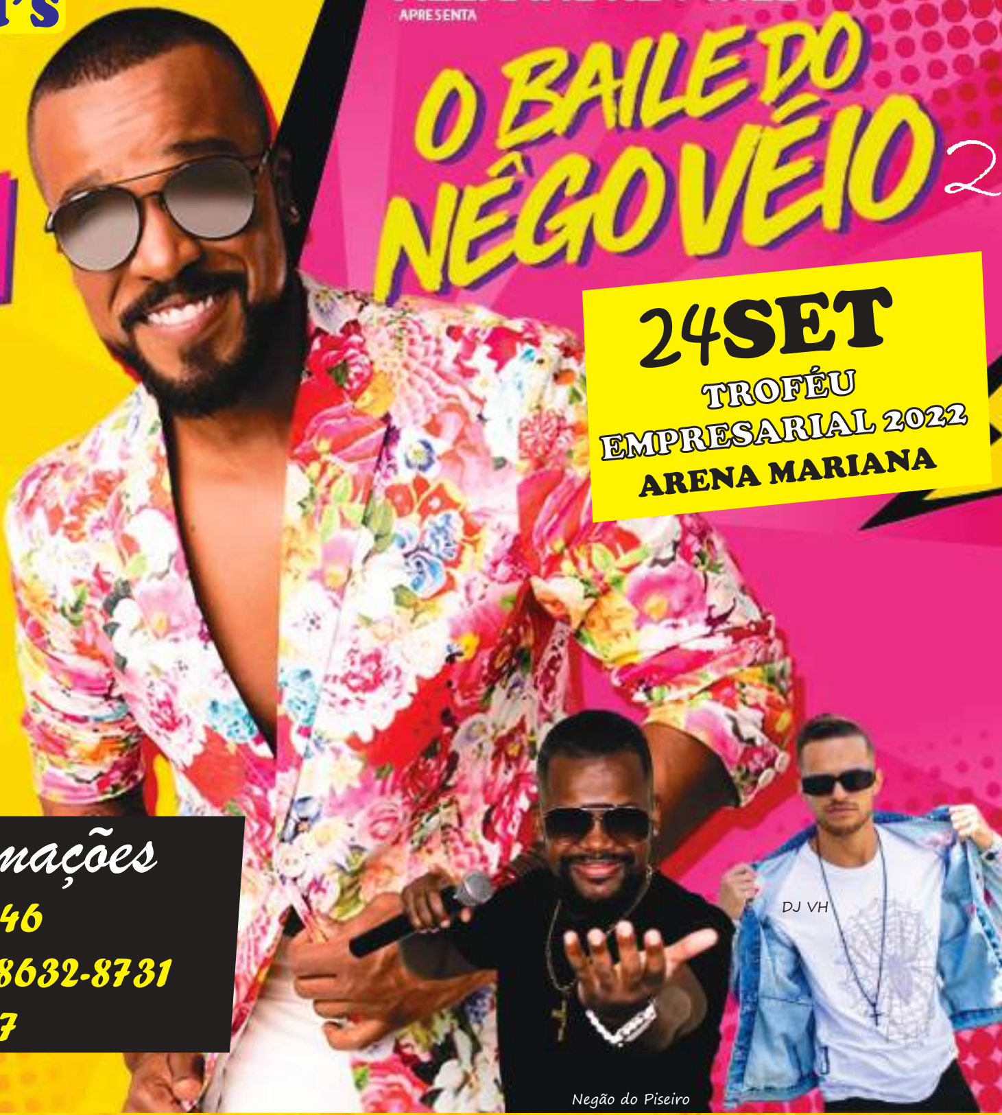
Negão do Piseiro