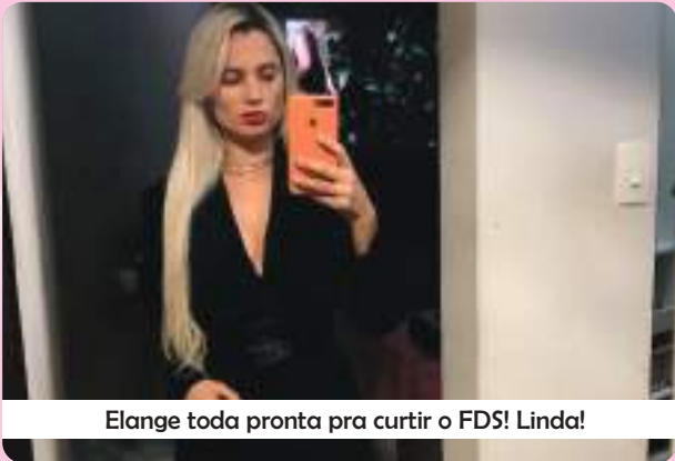
Elange toda pronta pra curtir o FDS! Linda!