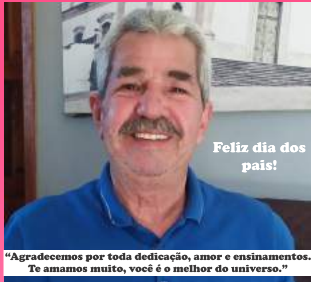
Feliz dia dos pais!

"Agradecemos por toda dedicação, amor e ensinamentos. Te amamos muito, você é o melhor do universo."