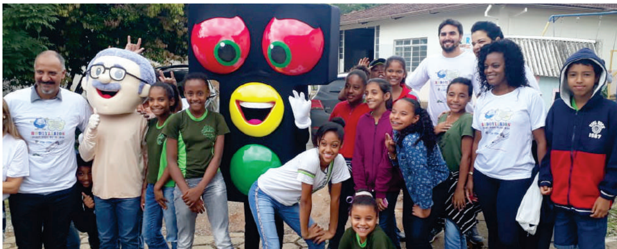
Show de talentos na comunidade da figueira! Confira reportagem completa em nosso canal do Youtube: /TVPanfletu's