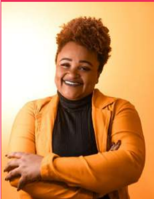
Empresária de sucesso da cidade de Mariana e Região, essa é Tina's Hair!