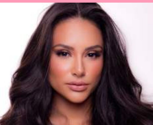
A mamãe Cris, sempre está com a vaidade em dia! Sempre linda e exuberante!