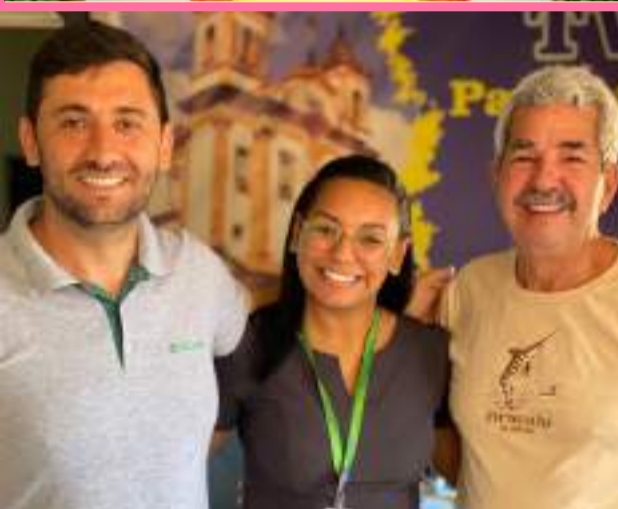
SICREDI em visita ao escritório do Jornal Panfletu's! É um prazer receber vocês!