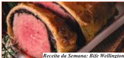
Receita da Semana: Bife Wellington

Para sugestões, críticas, comentários ou “mandado de prisão coercitiva”, encaminhar e-mail darcypc60@gmail.com.