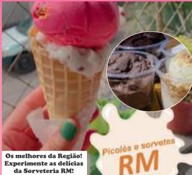
Os melhores da Região! Experimente as delícias da Sorveteria RM!