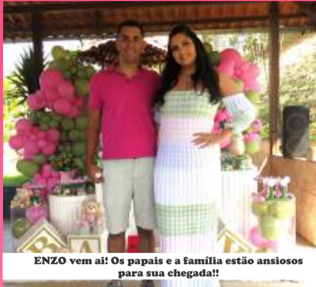
ENZO vem ai! Os papais e a família estão ansiosos para sua chegada!!