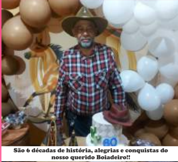
São 6 décadas de história, alegrias e conquistas do nosso querido Boiadeiro!!