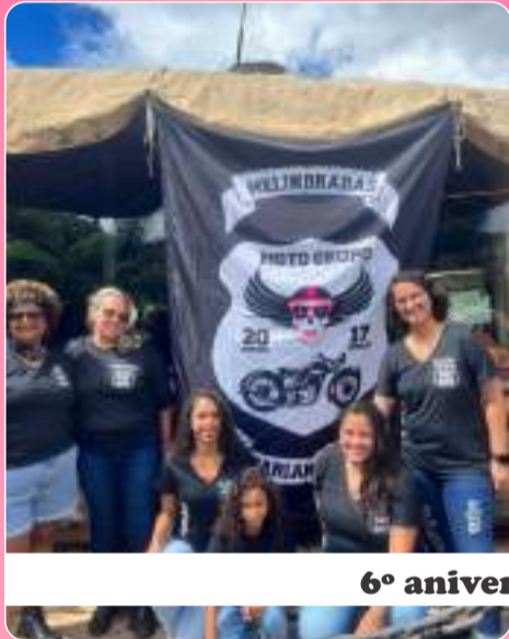
6º aniversário MELINDRADAS! Que sucesso!