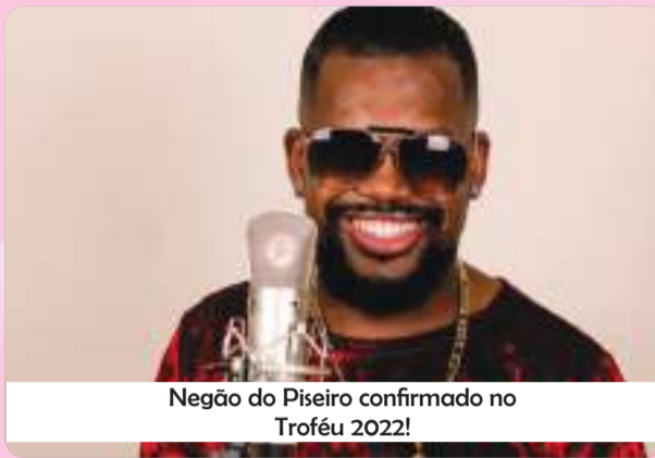
Negão do Piseiro confirmado no Troféu 2022!