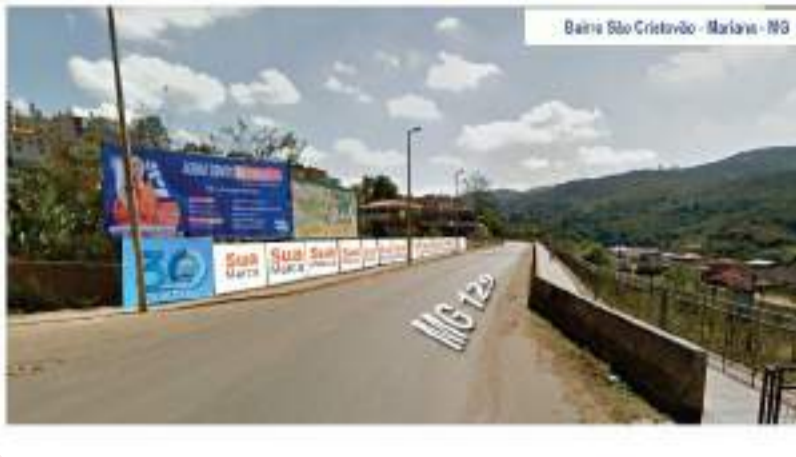
Espaço da Publicidade