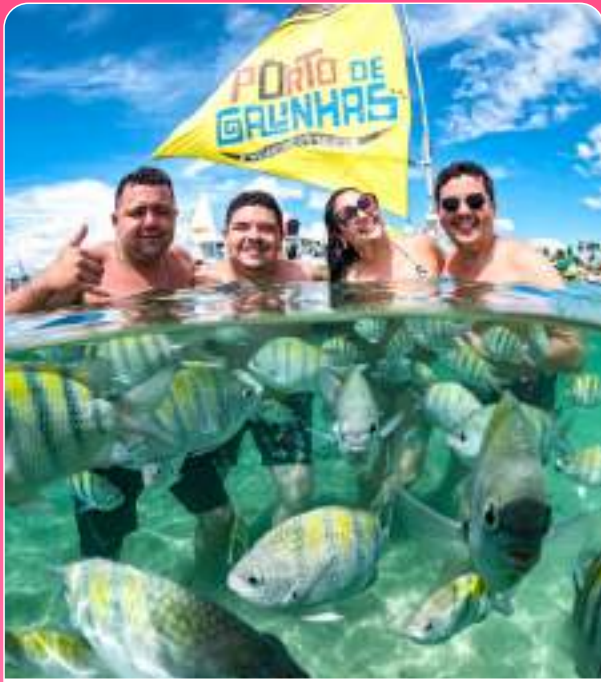
Trip dos irmãos Panfletu's! Foi excepcional Nordeste! Que estado maravilhoso!

Por aqui sempre aparece as notícias da semana, os aniversários, as homenagens, de tudo um pouquinho! Vem participar também - (31) 9 8632-8731