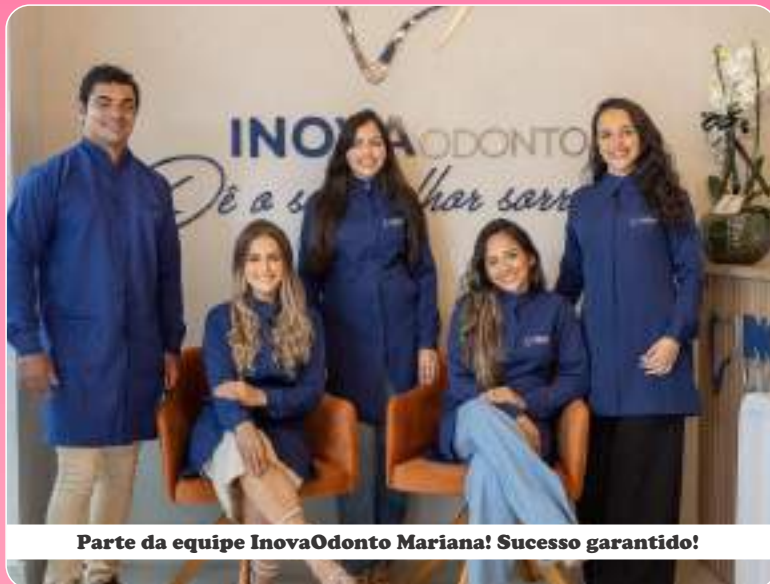
Parte da equipe InovaOdonto Mariana! Sucesso garantido!