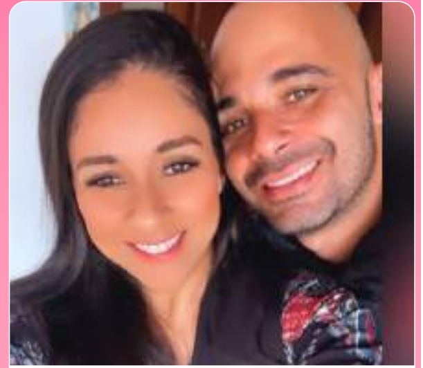
Casal F F Experiências! Sempre cheios de novidades!