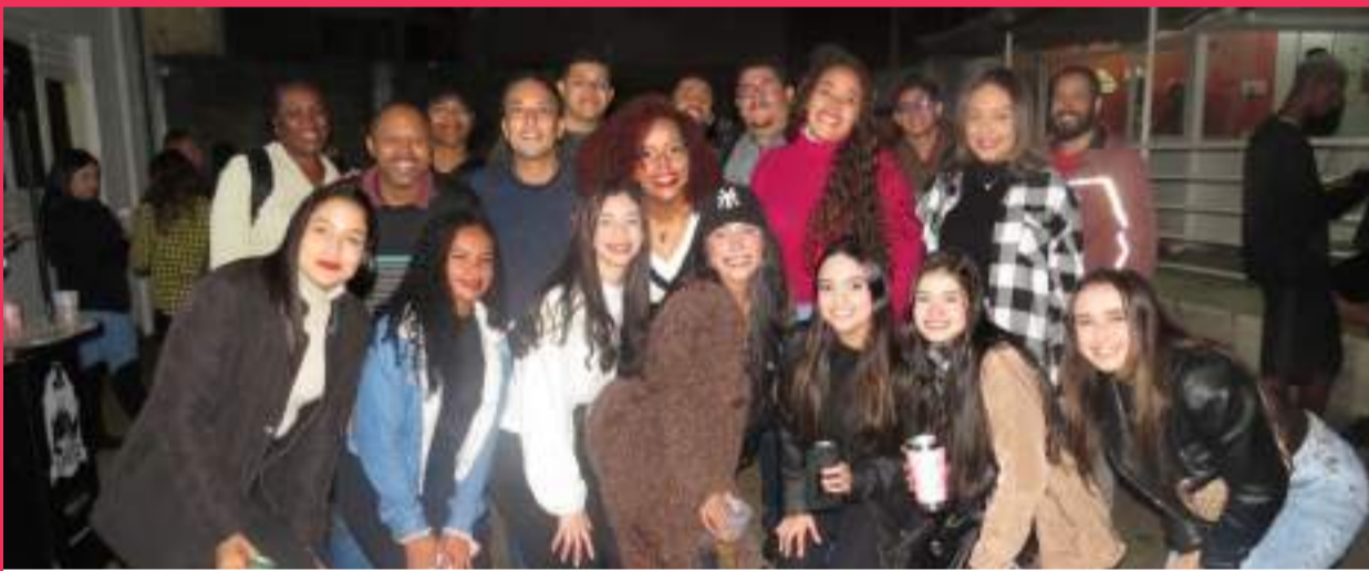
FUPAC NA PRÁTICA! Turma do 1º período de direito curtindo o evento que foi maravilhoso!