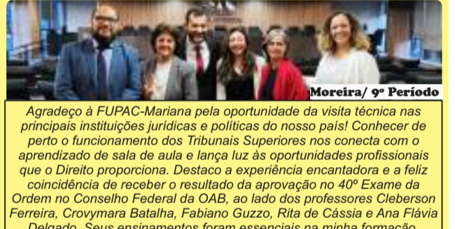
Moreira / 9º Período

Essa viagem técnica a Brasília só confirmou que esse era o caminho certo a seguir. Tivemos a oportunidade de ver de perto a funcionalidade e o funcionamento dos grandes órgãos superiores, participar de sessões plenárias e conhecer grandes profissionais do Direito. Foi uma experiência de extremo enriquecimento acadêmico, que me anima ainda mais a finalizar o curso com chave de ouro. Agradeço imensamente à FUPAC-Mariana e aos meus queridos professores pela oportunidade concedida.