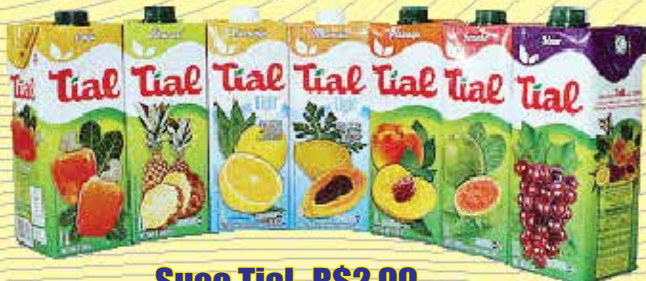
Suco Tial- R$2,99