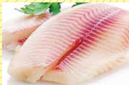
Filé de peixe panga R$12,90 Kg