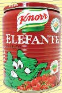
Extrato de tomate elefante 340g- R$3,19