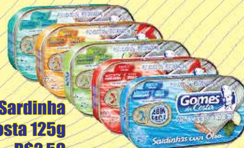
Sardinha Gomes costa 125g R$2,59