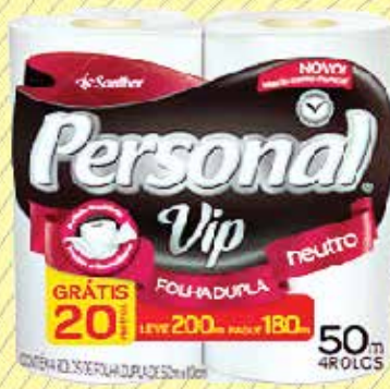
Papel higiênico personal vip 50m- R$13,90