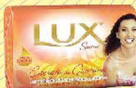
Sabonete Lux - R$0,99