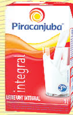
Leite piracanjuba R$1,79