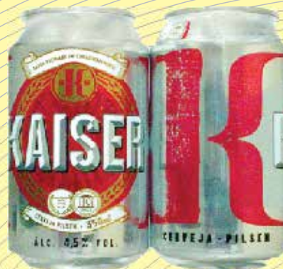
Cerveja Kaiser 350ml R$1,49