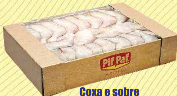
Coxa e sobre coxa pif paf à granel R$4,99 kg