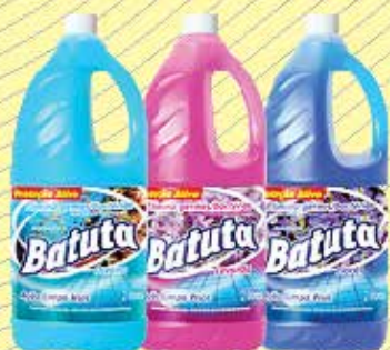
Desinfetante batuta 2L - R$3,99