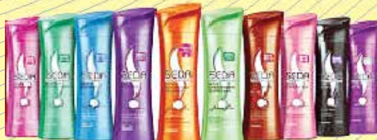
Shampoo Seda - R$4,99