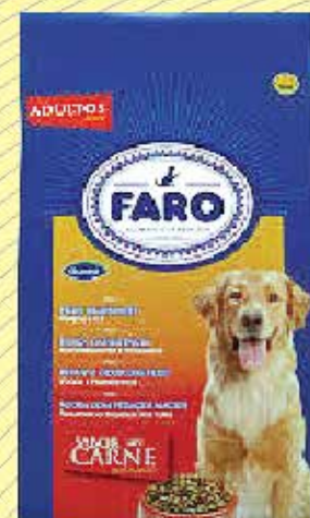
Ração Faro 8kg de carne- R$49,00