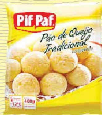
Pão de Queijo pif paf 400g- R$2,99