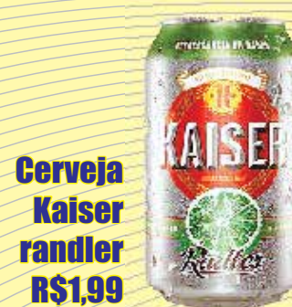
Cerveja Kaiser randler R$1,99