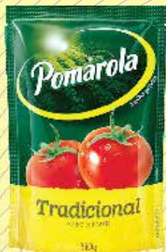
Pomarola sache tradicional- R$1,79